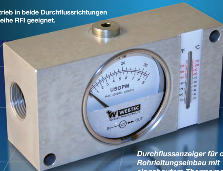
Durchflussanzeiger für den Rohrleitungseinbau mit eingebautem Thermometer

Für den Betrieb in beide Durchflussrichtungen ist die Baureihe RFI geeignet.